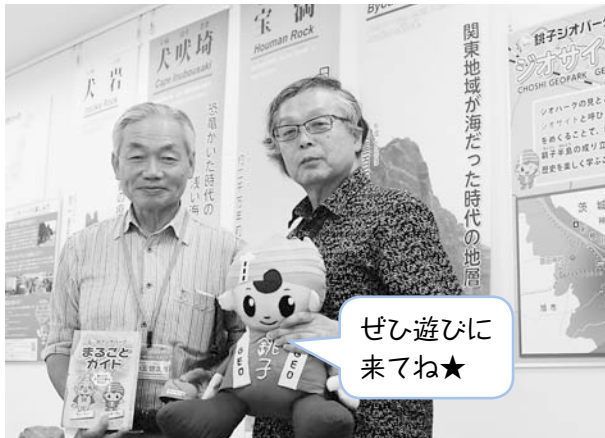
「なんでも聞いてね！」と常駐のジオガイドさん 銚子ジオパークビジターセンター(銚子セレクト市場)

ジオツアー前の情報収集やツアー後の復習には、「銚子ジオパーク展示室」や「銚子ジオパークビジターセンター」をぜひご利用ください。さらによくわしく銚子ジオパークのことを知りたい方は、常駐する係員へ声をかけてみましょう。パンフレットやホームページなどでは伝えきれない、とっておきの素敵な魅力を教えてくれますよ。