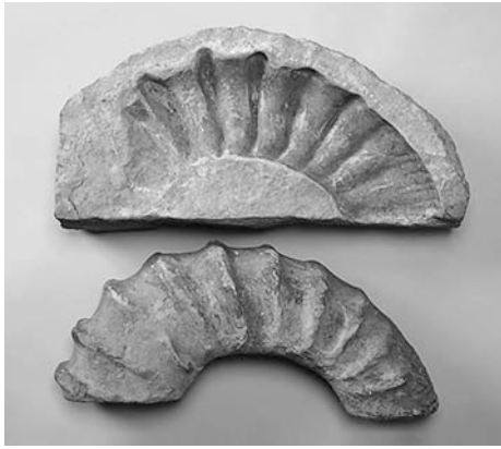
銚子産の化石(アンモナイト) 銚子ジオパーク展示室(青少年文化会館)

「ジオツアー」とは、ジオパークでジオサイトを巡るツアーのこと。「ジオサイト」とは、ジオパークの見どころ。銚子のジオサイトを巡ることで、銚子半島の成り立ちや、文化、歴史を楽しく学べ