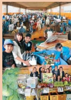
美味しさ満載 銚子の秋を堪能 第20回銚子市産業まつり

今年で20回目を迎える恒例の「銚子市産業まつり」が10月28日(日)、川口外港周辺で開催され、約3万8千人の来場者でにぎわいました。